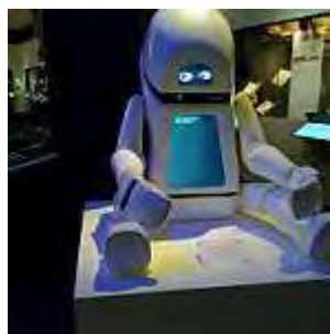
Figure 1. Robot at the British Library Science fiction Exhibition. D. Thornton, 2011.