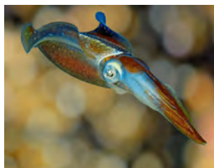
Figure 2. Un calmar de récif des Caraïbes ( Sepioteuthis sepioidea ) B. Will, 2006.